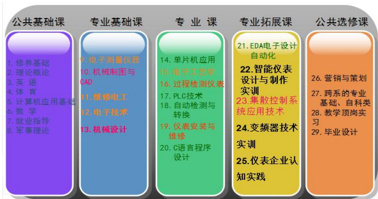
图 2 基于工作过程系统化的完整课程体系

根据电子仪器仪表生产和使用企业各岗位提炼出的典型工作任务和核心职业能力，归纳成行动领域，然后按照学生认知规律和能力递进原则，电子测量技术与仪器专业确定《单片机原理及应用》、《自动检测及转换技术》、《仪表安装与维修》、《过程检测仪表》与《集散控制系统应用技术》等五门专业核心课程。